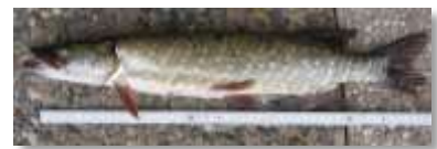
Bild: Hecht, Schonzeit 1.2.-15.4., Schonmaß 50 cm

Für die in § 2 Abs. 1 HFO aufgeführten Arten (Fische, Neunaugen, Krebse, Muscheln) gelten Schonzeiten und/oder Mindestmaße. Siehe auch S. 40.