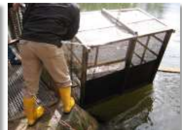
Bilder: Fischweg (Raugerinne), Kastenreuse vor einem Fischweg