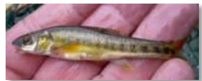
Bild: Elritze, ganzjähriges Fangverbot

Für die in § 1 HFO aufgeführten Arten (Fische, Neunaugen, Krebse, Muscheln) gilt ein ganzjähriges absolutes Fangverbot. Siehe auch S. 39.